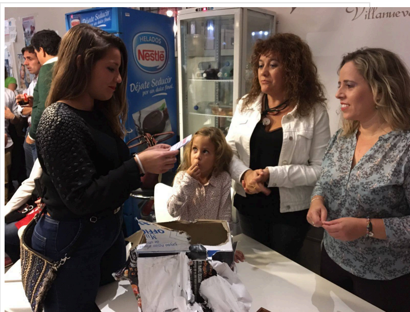
( http://www.villanuevadeloscastillejos.es/export/sites/vvadeloscastillejos/es/.galleries/imagenes-noticias/2016/Octubre/14570766_162811813 )