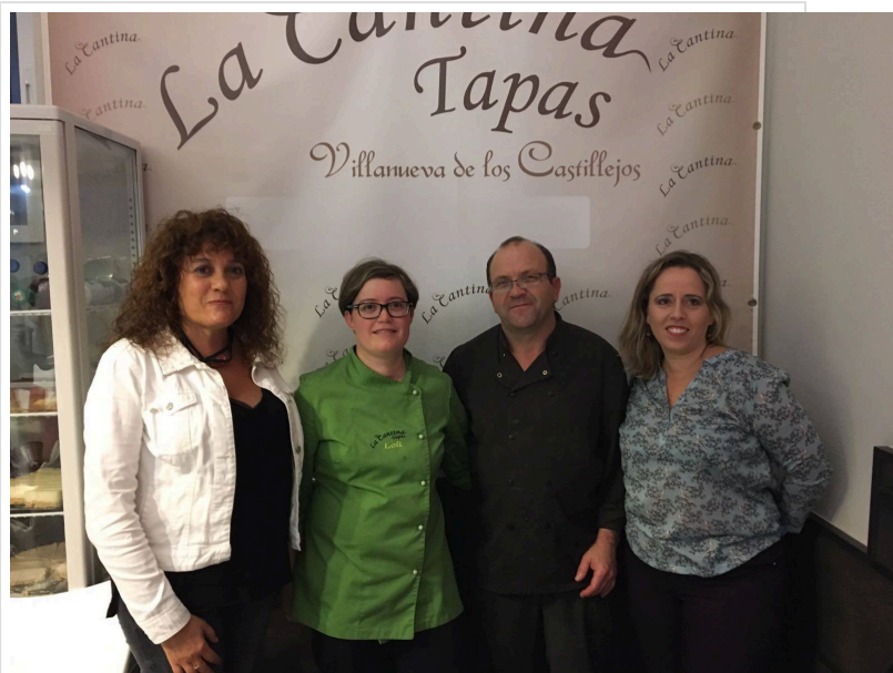
( http://www.villanuevadeloscastillejos.es/export/sites/vvadeloscastillejos/es/.galleries/imagenes-noticias/2016/Octubre/14715673_162811803 )